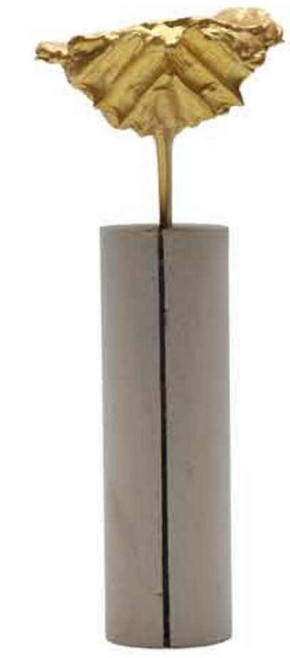
5. FONTE BATTESIMALE