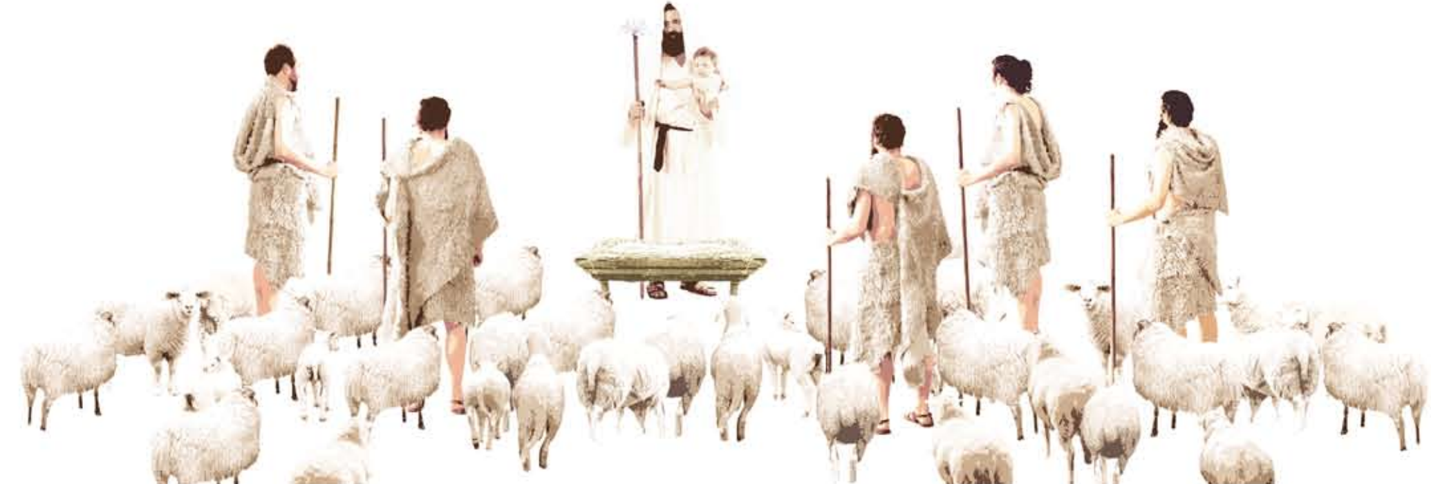
CICLO PITTORICO - PARETE SUD