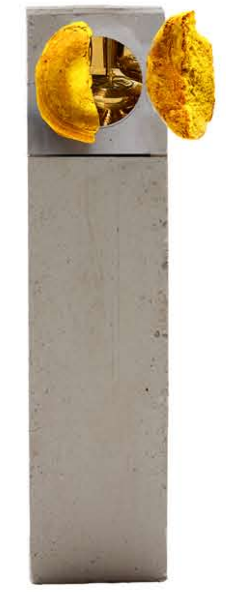
4. CUSTODIA EUCARISTICA