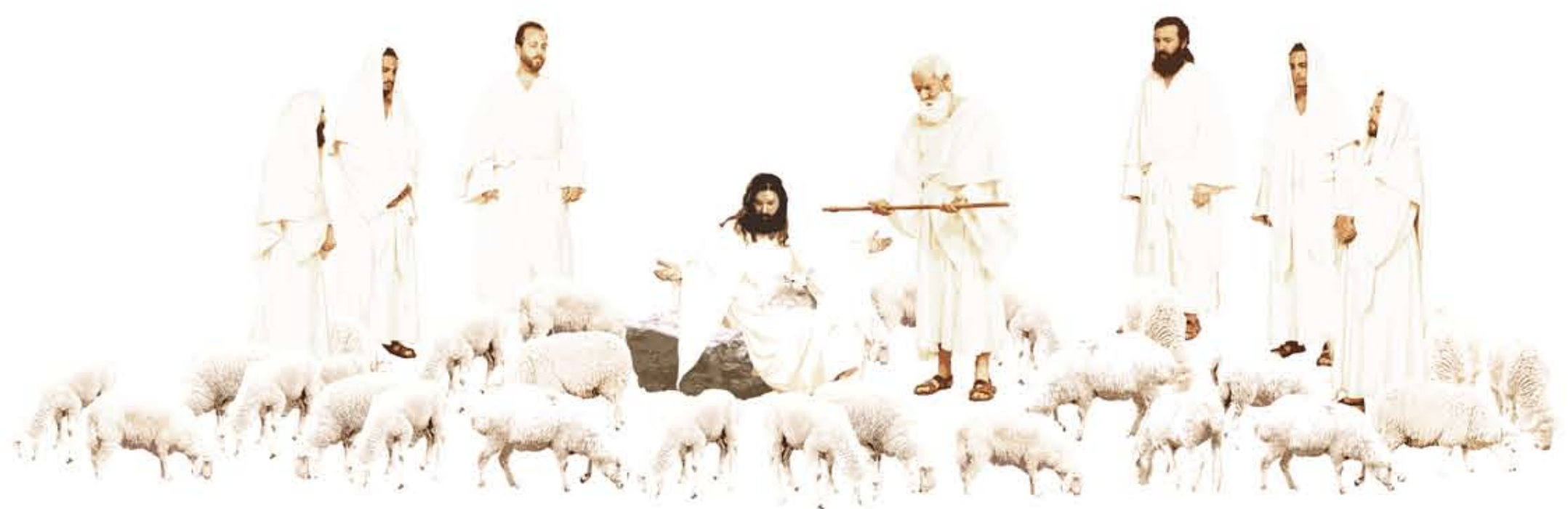
CICLO PITTORICO - PARETE NORD