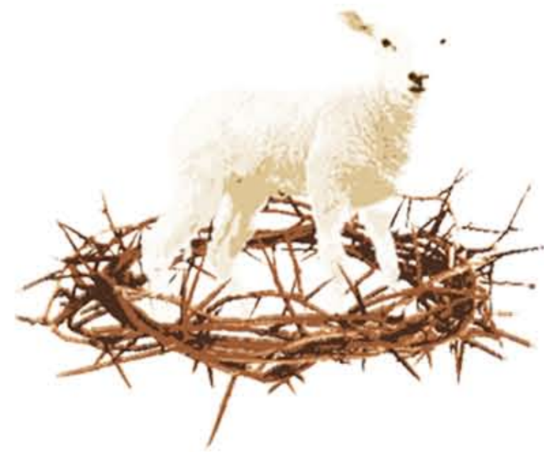
BOZZETTO DIGITALE PECORELLA SMARRITA / AGNELLO DI DIO