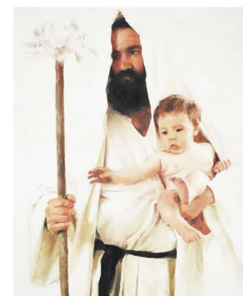
BOZZETTO PITTORICO SAN GIUSEPPE (DETTAGLIO)