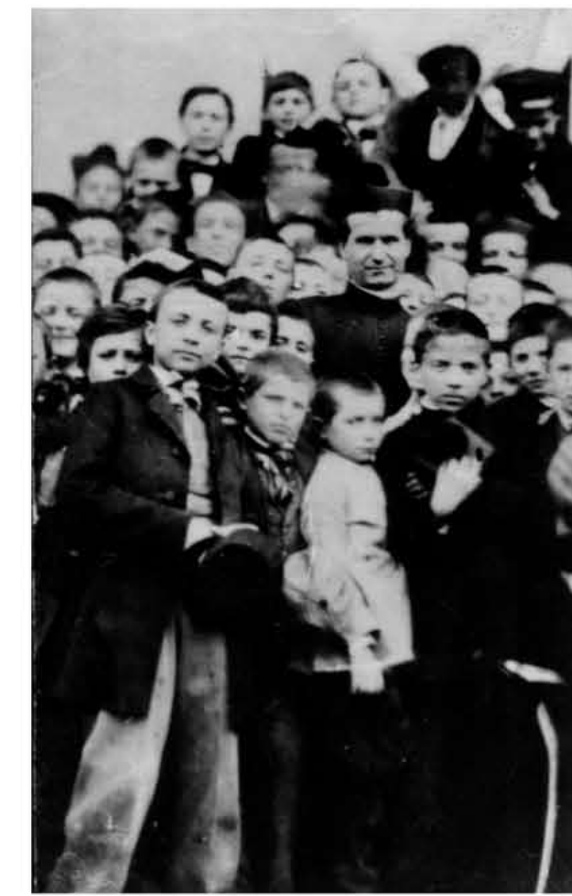
6. IMMAGINI DI SAN GIOVANNI BOSCO E ICONA MARIANA

In asse con la figura di Giovanni Bosco e Maria, raffigurate nella scena pittorica sovrastante, i medesimi santi sono qui presentati alla devozione della comunità tramite delle immagini artistiche.